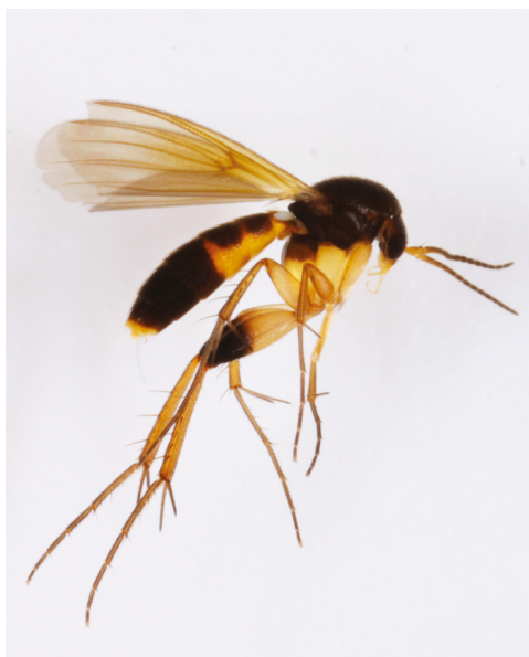
Figur 5. Sceptonia costata (van der Wulp, 1858), ♂.