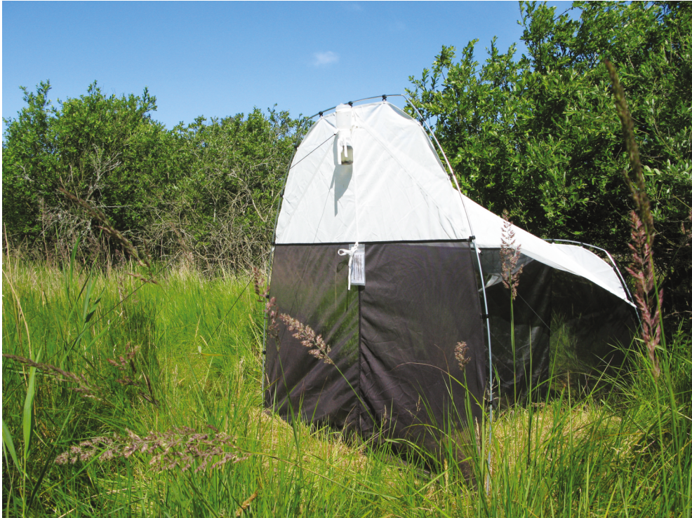
Figur 1. Malaisefælde i Pineskoven, juli 2019. — Malaise trap, Pineskoven, July 2019.

Habitusfotos (Figs 2–5, 7) er taget med Canon MP-E 65 mm f/2.8 1-5x Macro Photo. Genitaliefotos (Fig. 6A,B) er taget med LMscope LM digital SLR universal adapter monteret på mikroskop, stakket af flere eksponeringer og behandlet i programmet Zerene Stacker. Alle fotos er taget af WG.