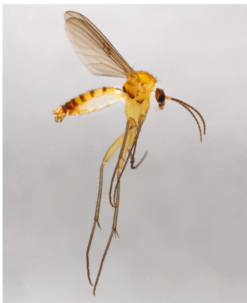
Figur 4. Mycomya fimbriata (Meigen, 1818), ♂.

** Megalopelma nigroclavatum (Strobl, 1910). NEZ, Pineskoven, 02.08.-11.08.2017, 1♀. Ny slægt og art for den danske fauna. Ikke medtaget som potentiel i Petersen & Meier (2001). I Europa kendes kun denne ene art af slægten Megalopelma Enderlein.