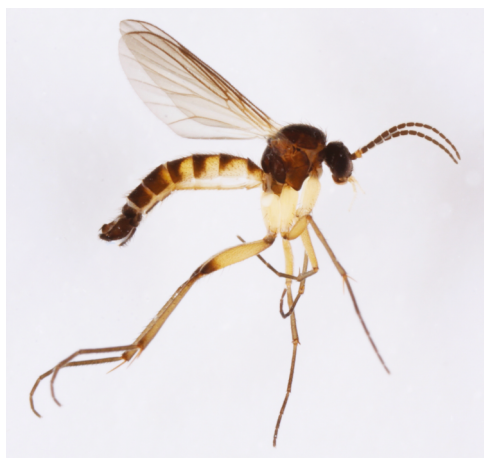
Figur 7. Synapha fasciata Meigen, 1818, ♂.

Zygomyia valida Winnertz, 1863. NEZ, Pineskoven, 17.08.-25.08.2017, 1♂.