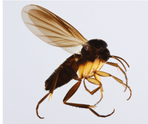
Figur 2. Monocentrotia lundstroemi Edwards, 1925, ♂. Figur 3. Docosia fumosa Edwards, 1925, ♀.